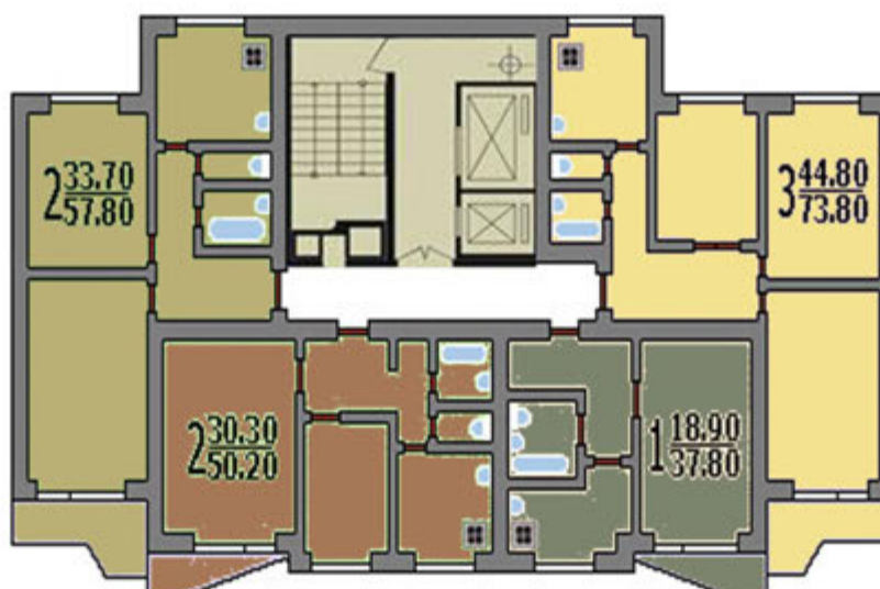
СХЕМА ТИПОВЫХ СЕКЦИИ С РАСПОЛОЖЕНИЕМ КВАРТИР

Имеют они и свои преимущества перед домами еще более ранней застройки: два лифта, наличие балконов в каждой квартире, просторные прихожие, удобные ванные комнаты, большие кухни.