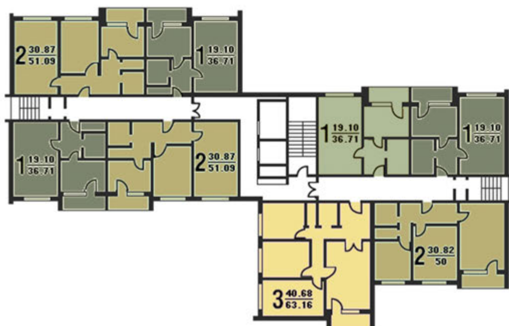
СХЕМА ТИПОВЫХ СЕКЦИИ С РАСПОЛОЖЕНИЕМ КВАРТИР

Тип дома: панельный Планировочное решение: дома (башни) коридорного типа с 1, 2 и 3 комнатными квартирами Этажность: 16 этажей Высота потолков: 2,64 м Технические помещения: подвал и техэтаж для размещения инженерных коммуникаций Лифты: 2 (пассажирский, грузовой) Строительные конструкции: наружные стены керамзитобетонные однослойные панели толщиной 350 мм; внутренние железобетонные - 180 мм; перегородки - 120 мм; перекрытия железобетонные - 140 мм Отопление: центральное, водяное Вентиляция: естественная вытяжная на кухне и в санузле Водоснабжение: холодная и горячая вода от городской сети Мусороудаление: мусоропровод с загрузочными клапанами на межэтажной лестничной площадке